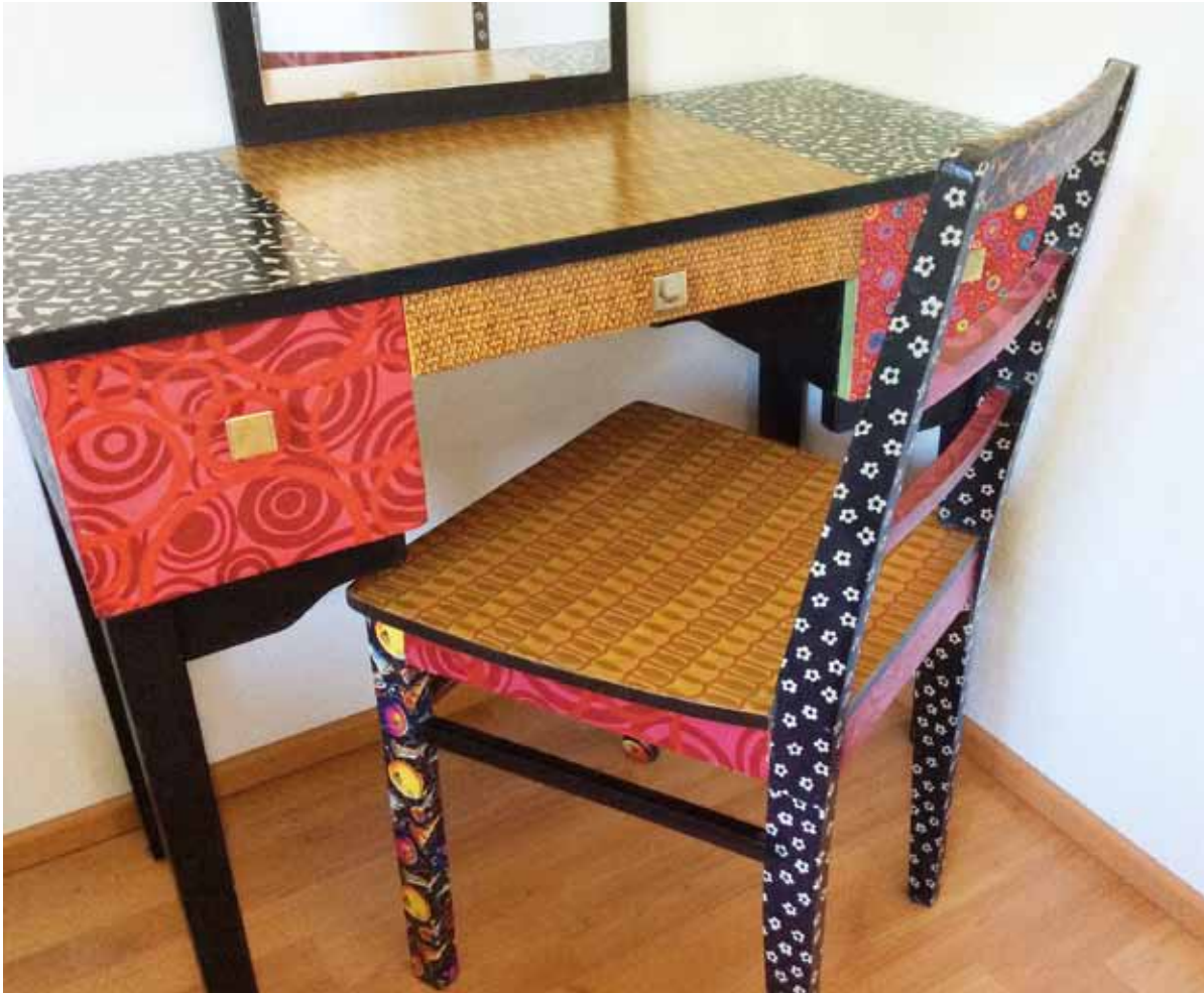
IRENEN kampauspöytä on todellinen kokoomateos. Esimerkiksi pöytäosa on löytynyt vantaalaisesta roskiksesta ja jalat ovat kainuulaisen kotitalousopettajan sohvapöydästä.